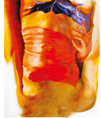
Atelier #1 | dessin du torse Samedi 26 octobre, de 8 h 30 à 16 h 30 | 100$

Centre communautaire Alain-Pagé Matériel requis : communiqué avec le Service des loisirs pour connaître la liste du matériel requis.