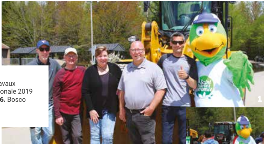
1. et 2. Journée des Travaux publics. 3. La Fête nationale 2019 4. Fort St-Charles 5 et 6. Bosco Naturellement Musical