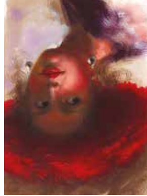
Atelier #2 | Chapeau rouge Samedi 2 novembre, de 8 h 30 à 16 h 30 | 100$