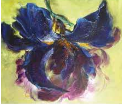
Atelier #3 | Iris Magique Samedi 9 novembre, de 8 h 30 à 16 h 30 | 100$